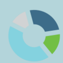
ANALISI DEI COSTI E DI MERCATO