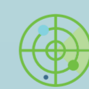
ANALISI DELL'IDEA E RICERCA ANTERIORITÀ

PER CAPIRE SE L'IDEA È EFFETTIVAMENTE NUOVA E REALIZZABILE ISINNOVA COMPIE ANALISI E RICERCHE SULLA FATTIBILITÀ.